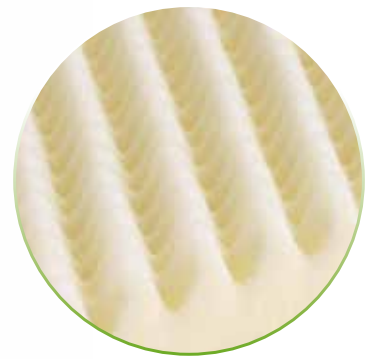
Noppenprofil für optimale Anpassung